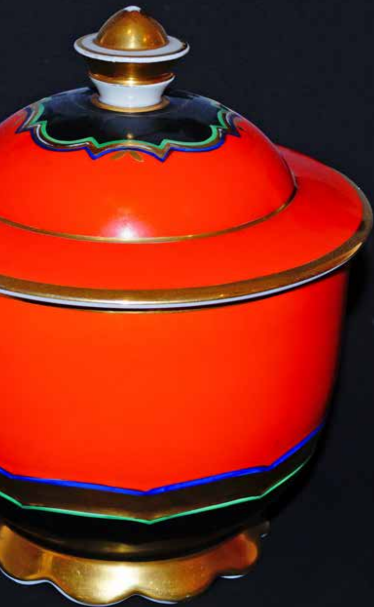
Deckeldose von Bavaria Ullersricht, mit rotem und schwarzem Fond, Goldrand sowie goldenen, blauen und grünen Staffagen, um 1930.