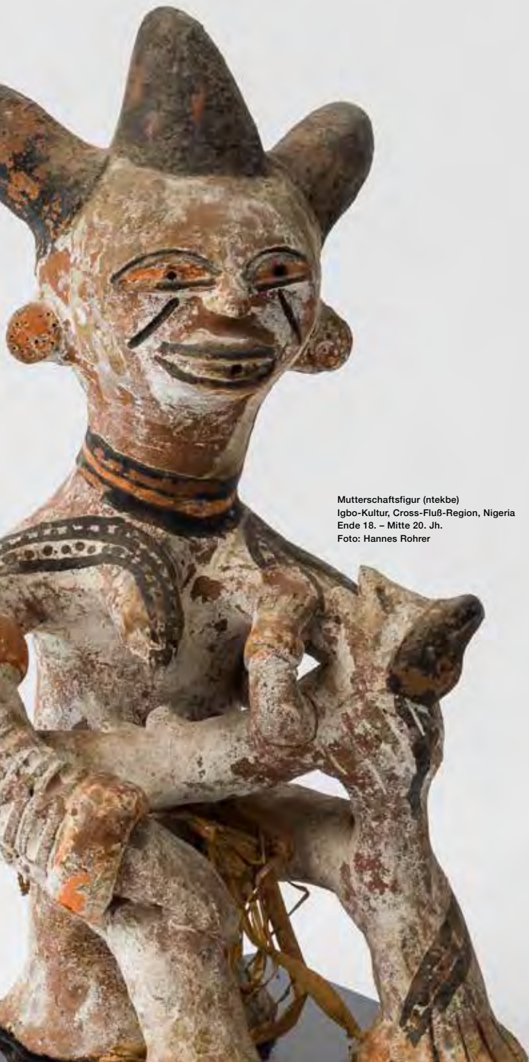
Mutterschaftsfigur (ntekbe) Igbo-Kultur, Cross-Fluß-Region, Nigeria Ende 18. – Mitte 20. Jh.