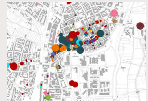
Plan Einzelhandelsbestand Innenstadt 2022 DMA GmbH, 2.2.21 | Plangrundlage: Stadt Weiden, 2021

Das Gros der Einzelhandelsbetriebe ist im Innenstadtbereich Weidens verortet. Die Innenstadt ist durchsetzt von zahlreichem Einzelhandel unterschiedlichster Branchen , wobei kleinere Ladengrößen mit Verkaufsflächen von unter 400 m 2 überwiegen. Großformatige Einzelhandelsbetriebe sind in der Innenstadt in vergleichsweise geringem Umfang vorzufinden. Die Hauptlagen des innerstädtischen Einzelhandels bilden die Max-Reger-Straße, Würthstraße (inkl. Macerataplatz) und der Obere Markt . Der Angebotsschwerpunkt liegt in den klassischen Leitsortimenten aus dem Mode- sowie dem Lebensmittelbereich.