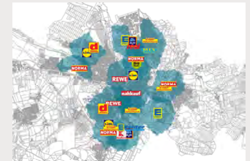
Plan Nahversorgung mit fußläufigen Einzugsbereich DMA GmbH, 2.2.21 | Plangrundlage: Stadt Weiden, 2021

In Bezug auf eine wohnortnahe Versorgung der Bewohner*innen mit Waren des täglichen Bedarfs ist zudem die räumliche Verteilung der strukturprägenden Lebensmittelmärkte von erheblicher Bedeutung.