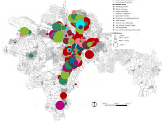
Plan Einzelhandelsbestand 2022 DMA GmbH, 2.2.21 | Plangrundlage: Stadt Weiden, 2021

Die durchschnittliche Verkaufsfläche der Weidener Einzelhandelsbetriebe beläuft sich auf rd. 482 m 2 je Geschäft. Auch heute dominieren jedoch in Weiden insbesondere Kleinbetriebe mit einer Verkaufsfläche von weniger als 100 m 2 (ca. 52 % der Geschäfte), wohingegen knapp 14 % der Einzelhandelsbetriebe großflächig einzustufen sind, d.h. auf einer Verkaufsfläche von mehr als 800 m 2 agieren.